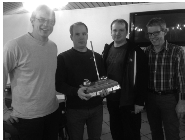
Sieger 14. Flädermus Trophy: Team Steiesel